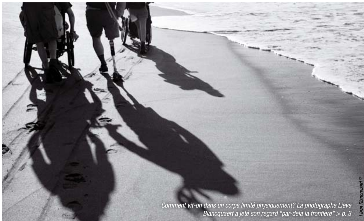
Comment vit-on dans un corps limité physiquement? La photographe Lieve Blancquaert a jeté son regard "par-delà la frontière" > p. 3

Avant mai 2003, le degré d'handicap des enfants se déterminait en fonction de "l'échelle belge officielle fixant le degré d'handicap" ou d'une liste spécifique des maladies pédiatriques. Au départ, cette échelle était destinée aux adultes, en particulier aux militaires, et ce n'était donc pas vraiment un critère adéquat pour juger de l'handicap physique ou psychologique d'un enfant. En effet, on se contentait de comparer l'enfant à l'handicapé adulte (plutôt qu'à une personne saine du même âge). Pour fixer le degré